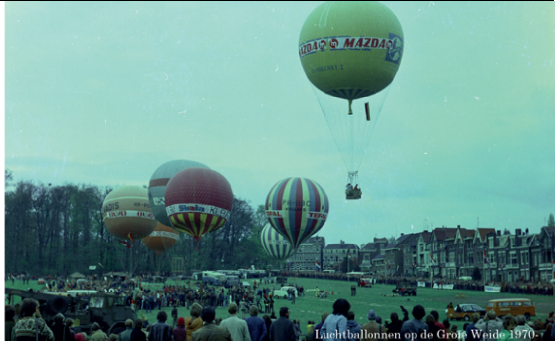
Luchtballonnen op de Grote Weide 1970.

Vandaag is Sonsbeek nog steeds een 'volkspark' dat gezien én gebruikt mag worden. Het is bekend bij alle Arnhemmers. Niet alleen om het fraaie groen, maar ook als festival-locatie. De inrichting en infrastructuur van het park maakt deze functie mogelijk, naast de andere functies als wandelpark, 'groene long' en leefgebied van flora en fauna. Je komt er als kind en je gaat er ook weer met je (klein)kinderen naar toe.