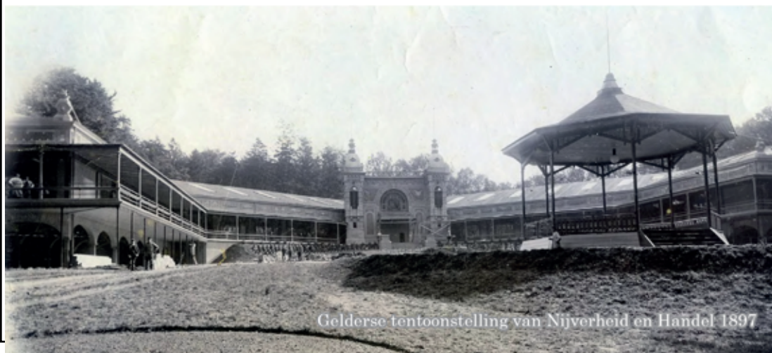
Gelderse tentoonstelling van Nijverheid en Handel 1897

Het totale beheerde gebied bestaat feitelijk uit drie parken die in elkaar overlopen: Gulden Bodem, Zijpendaal en Sonsbeek. Elk park heeft een eigen karakter en sfeer, bepaald door de natuurlijke omstandigheden en de gebruiksfuncties. Zo zijn er aparte zones waar de rust en de natuurlijke beleving voorop staan, en zones voor de levendigheid van publieksgebruik. Liefhebbers weten precies waar de zeldzame goudveil groeit en waar de vleermuizenbomen staan, maar ook waar je met vrienden het beste kunt picknicken of een concert meemaken.