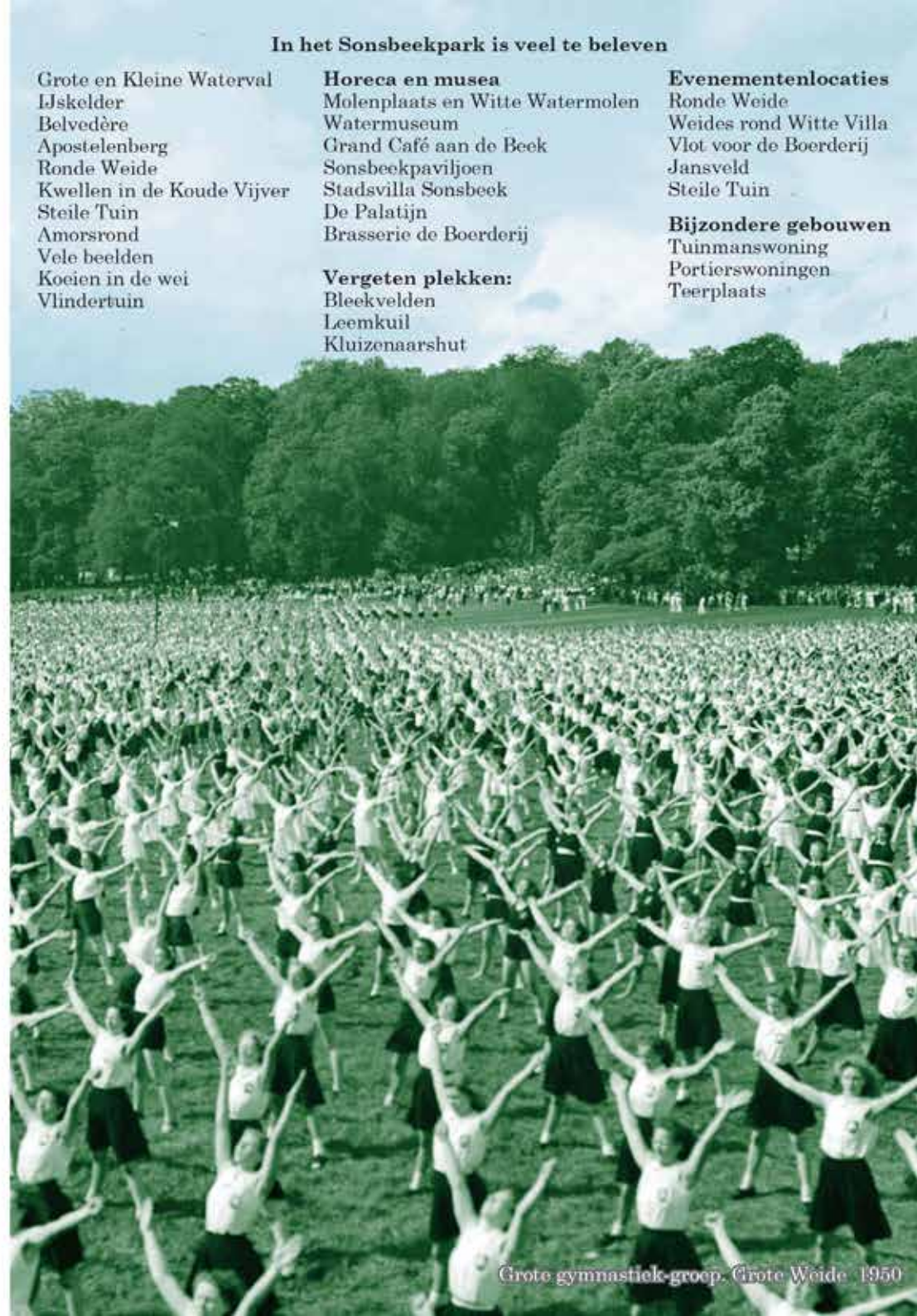
Grote gymnastiek-groep, Grote Weide 1950