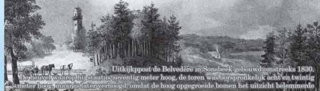
Uitkijkpost de Belvédère in Sonsbeek gebouwd omstreeks 1830. De nevel waarop hij staat is zeventig meter hoog, de toren was oorspronkelijk acht en twintig meter hoog, maar is later verhoogd, omdat de hoog opgegroeide bomen het uitzicht belemmerde.

Het Arnhemse rijksmonument Sonsbeekpark is een prachtig natuurgebied in hartje stad. Mensen komen er graag, om te genieten van het groen en van alles wat er in dat groen wordt georganiseerd. Mede door de bijzondere aanleg kan Sonsbeekpark dat best hebben. Met de juiste spelregels én handhaving, en met een duidelijke zonering voor de diverse functies van het stadspark, biedt Sonsbeek ruimte voor flora, fauna en misschien nóg wel meer publiek dan nu.